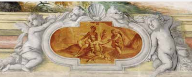
Eracle e Onfale