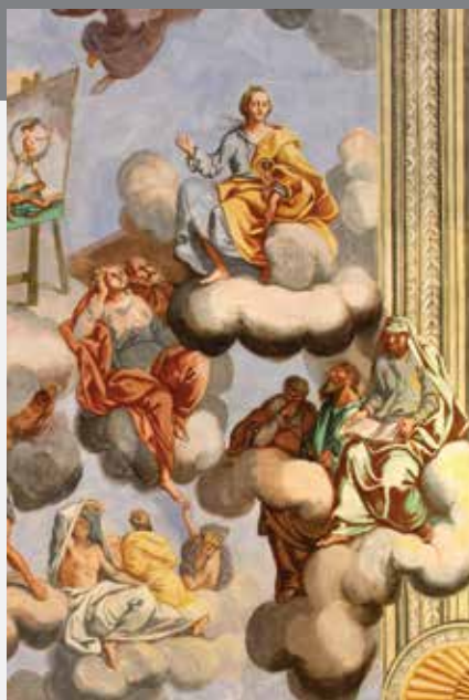
Allegoria della Guarigione – Igea con il bastone di Esculapio