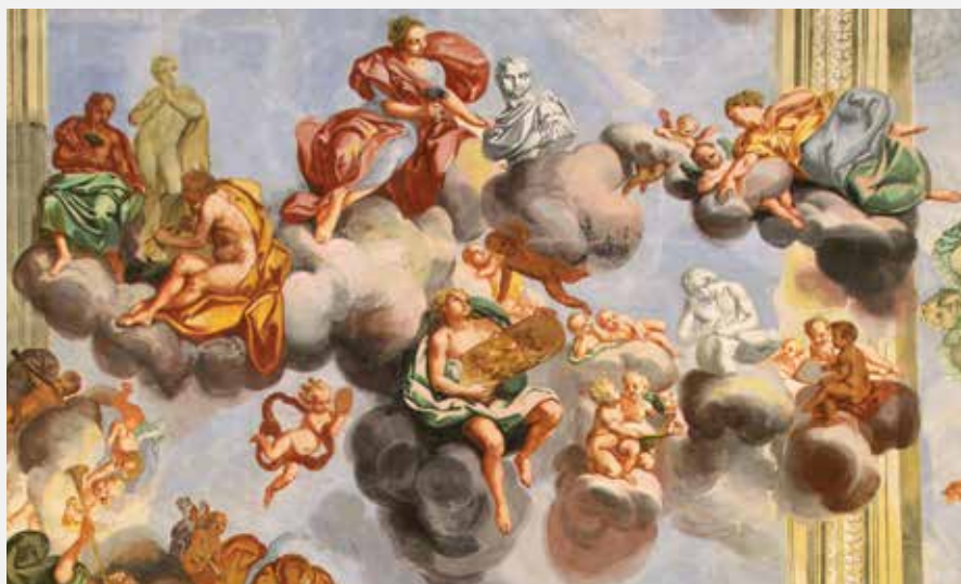
Allegoria della Scultura consiste in tre gruppi figurativi con sculture di diversi periodi