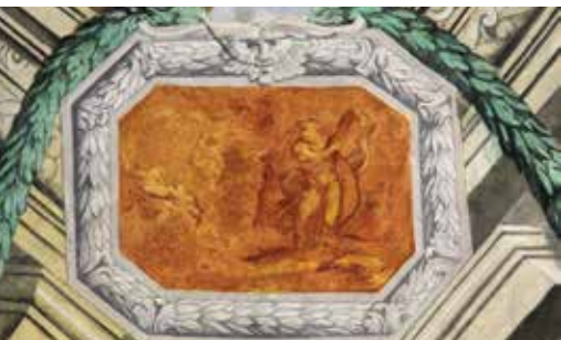
Giobbe sul mucchio di letame