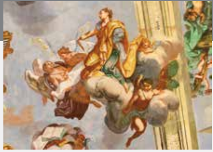
Allegoria della Geometria – forse la musa POLIMNIA (gr. “ricca di poesie”), la musa della geometria, del mimo e della meditazione