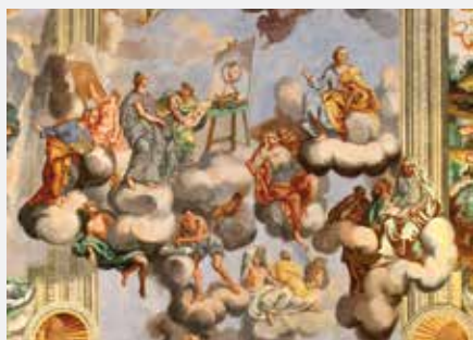
Allegorie delle Arti e delle Scienze Gruppo figurativo – una metafora della pittura