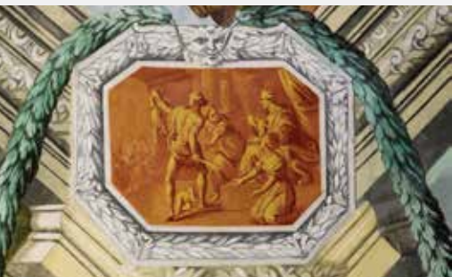
Il giudizio di Salamone