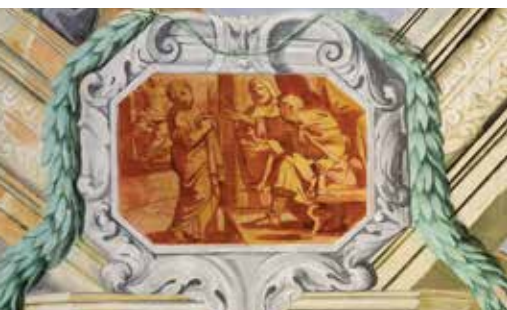
Forse Ester davanti al re Assuero