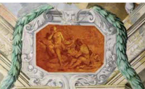
Una scena sconosciuta