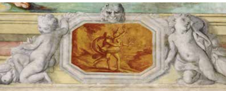
Apollo e Dafne