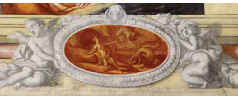
Andromeda e Perseo