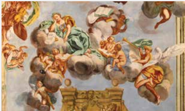
Allegoria della poesia – forse la musa CALLIOPE (gr. “dalla bella voce”), la musa della poesia epica, la più antica e saggia di tutte le muse