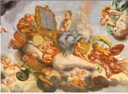
Allegoria della Musica , forse la musa di EUTERPE (gr. “colei che rallegra e intrattiene”), la musa della musica, specialmente del canto lirico e la personificazione della poesia lirica