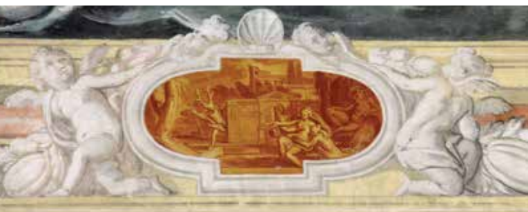
Eracle al bivio